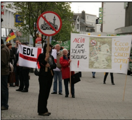
Kundgebung von pro NRW

Auch die NPD führte in Solingen eine Kundgebung durch. Der Veranstaltung unter dem Motto „Arbeit für Millionen statt Profit für Millionäre“ konnten jedoch gerade 26 Anhänger etwas abgewinnen. Ungleich mehr protestierten gegen die rechtsextreme Partei.